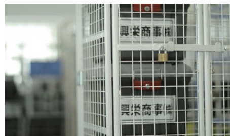
セキュリティカーゴ