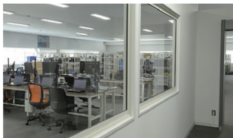
セキュリティルーム